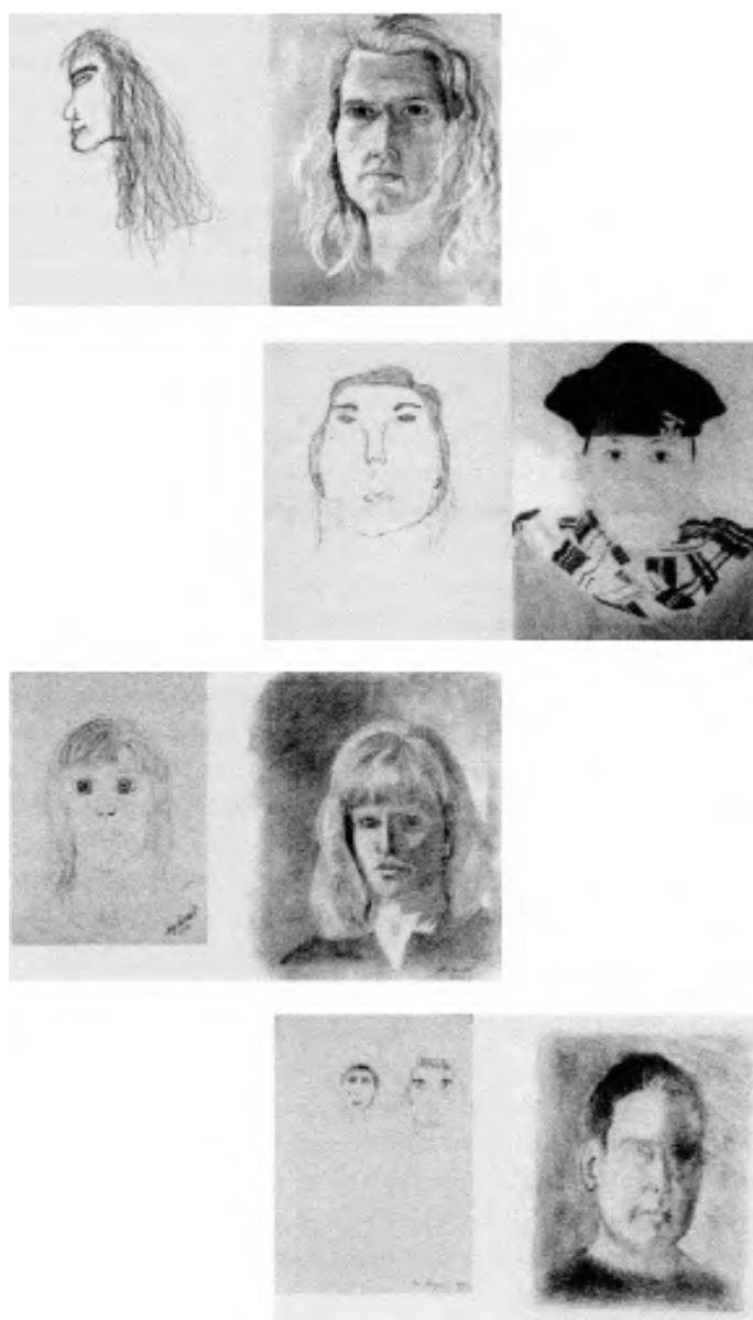
图 1 画作对比

我不会赘述我当时的局促感和我糟糕的绘画作品，尽管这两点都是明摆的事实。我讲这个故事是为了作铺垫，引出在看到《用右脑绘画》（ Drawing on the Right side of the Brain ）这本书时我的惊讶和喜悦。你可以在图 1 中看到参加了这本书作者贝蒂·爱德华兹（Betty Edwards）的短期绘画课程后的一些学生自画像的对比：左边是学生们刚进入培训班时的自画像，右边是五天的课程结束后他们的自画像。